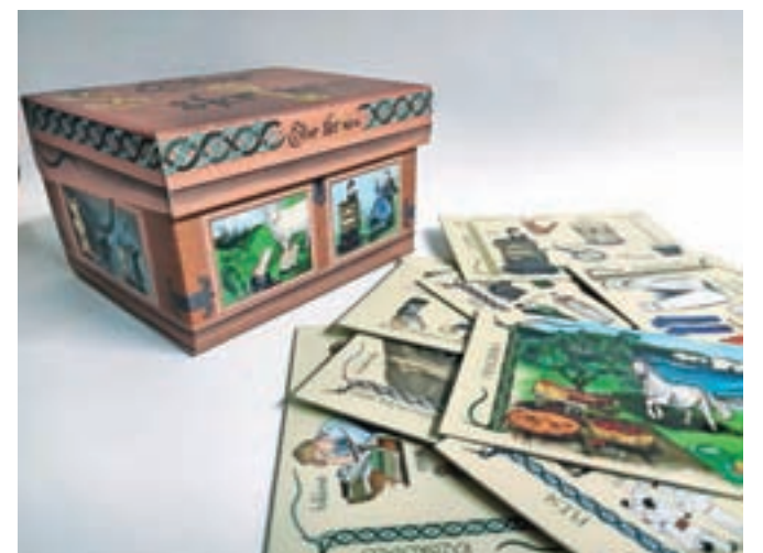
Etno skrinca – zabavno spoznavanje Slovenije in njenih kulturnih in naravnih znamenitosti