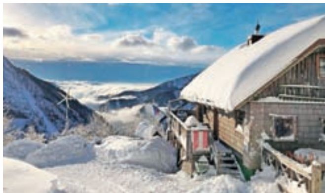
Kočja na starem Ljubelju je vse leto odprta od srede do nedelje od 8. do 17. ure, le 24. in 31. decembra do 15. ure.

narekujejo koronavirusne razmere in ukrepi. Iz PD Križe so sporočili, da je odprta kočja na Kriški gori in tudi Zavetišče v Gozdu posluje po rednem obratovalnem času. Odprt je tudi Taborniški dom Šija. Več informacij o delovnem času je na voljo na spletnih straneh ponudnikov.