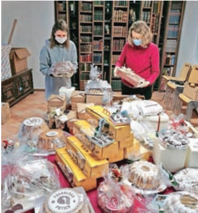
Deseta dobrodelna dražba prazničnih slaščic je potekala v nekoliko prilagojeni obliki.

dobrodelno poslanstvo, ki družji somišljenike v Rotary in Lions klubih po vsem svetu. Obenem bomo na ta način praznično vzdušje soustvarjali tudi za tiste, ki sicer praznikov zaradi tež-