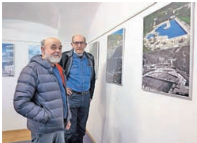
Tržiški bazen se je tudi z novo obliko približal plaži, menita fotografa Milan Malovrh in Stane Perko.

Tržič – v prvi polovici decembra je bila v Galeriji Atrij na ogled zanimiva fotografska razstava z naslovom Tržič nekoč in danes. Razstavnici projekt ponovnega fotografiranja motivov s starih razglednic Tržiča in okolice z enakih stajnih pozicij kot prvič so pripravili v Foto klubu Tržič ob podpori Občine Tržič in sodelovanju Tržiškega muzeja.