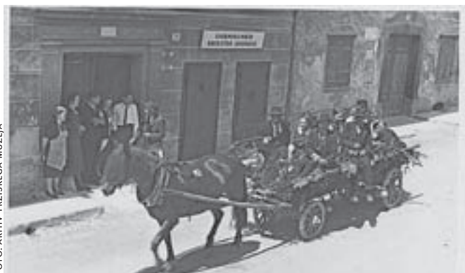
Pri Kristanu/pri Urmoharju na Trgu svobode 29 v Tržiču