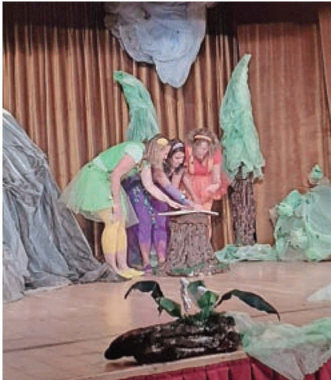
V šentanski gozd, najbrž na področje današnje Čarovce, pridejo tri damice, izvirno domače poimenovane čaruhle, ki svojih čarobnih moči še niso dodobra odkrile ...