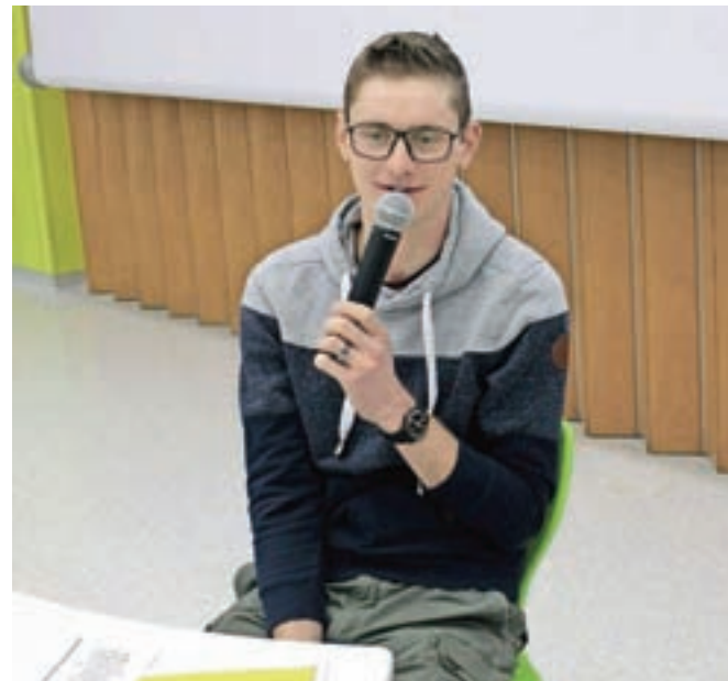
Obiskal nas je kolesar Matej Mohorič.

V knjižnici smo letos še posebno pozornost posvetili spodbujanju branja pri otrocih in mladih, kajti epidemija je mnoge prikrajšala za stik s knjižnico. Potreba po novem projektu za spodbujanje branja se je pokazala zlasti pri učencih zadnje triade, pri katerih je upad zanimanja za branje v primerjavi z učencih nižjih razredov še posebno opazen. Z mislijo, da je to populacija, ki v mladih zvezdnikih išče svoje idole in veliko časa preživi na družbenih omrežjih, hkrati pa jo čaka odločitev za vpis na srednjo šolo in s tem morda tudi že odločitev za izbiro poklica, smo se odločili, da spodbujanje branja združimo s poklicno orientacijo, hkrati pa otroke povabimo k aktivnemu sodelovanju s knjižnico na družbenih omrežjih. Tako je nastal projekt Drzni.si, ki se je začel 2. novembra 2021 in se bo zaključil 6.