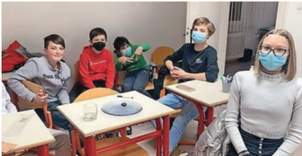
Na Podjetniški akademiji za mlade letos sodeluje osem osnovnošolcev in šest srednješolcev iz tržiške občine.

"Namen podjetniških krožkov je, da mladi predstavijo svojo podjetniško idejo."