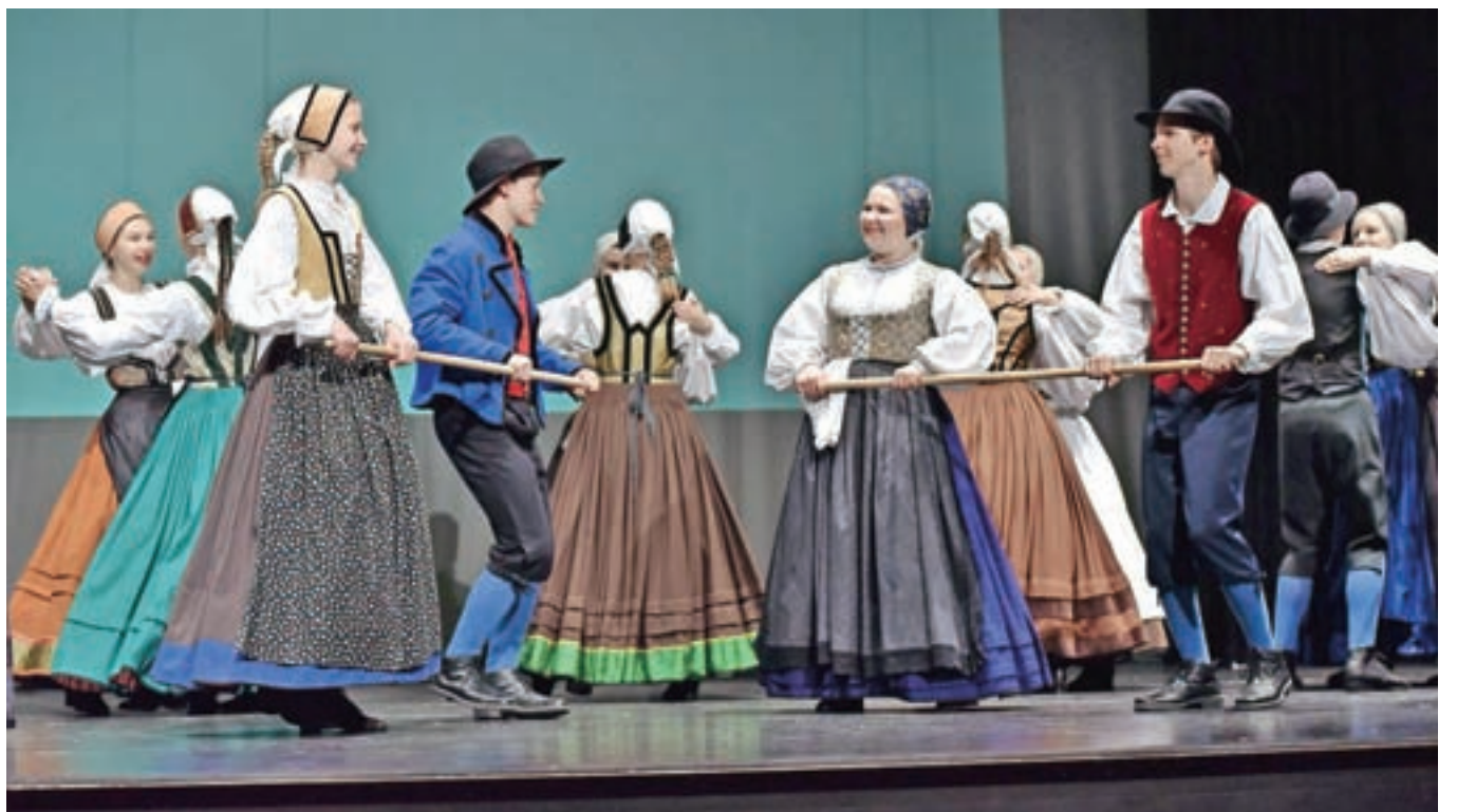
Kulturno društvo FS Karavanke vseskozi dokazuje kakovost svojega poustvarjanja slovenskega izročila.