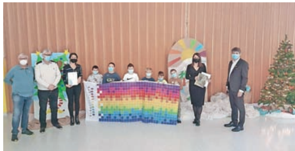
Podelitev priznanja kulturna šola Osnovni šoli Bistrica

tudi učenci 3. a in 3. b z Ježkovo pesmijo Prižgimo luč in zapeli pesem o šoli. Kljub covidnim omejitvam nam je uspelo ta dogodek približati vsem učencem in zaposlenim na šoli. V prejšnjem in letošnjem šolskem letu je bilo polno omejitev, zato smo ponosni, da smo na šoli iznajdljivi in da v različnih medijih še vedno razvijamo in spodbujamo ustvarjalnost in kulturno udeleževanje. Tako smo dva dni prej pripravili kratek kulturni program in ga pred Domom Petra Uzarija predstavili zaposlenim in oskrbovancem ter jim podarili paketa ročno izdelanih daril učencev 8. a ter prijazna sporočila učencev naše šole, ki so nastala v okviru tehniškega dne – Mala pozornost za veliko veselje, z mislijo, da jim polepšamo praznične dni. Ker smo ustvarjalno nemirni, pa že pripravljamo šolsko prireditev ob dnevu samostojnosti in enotnosti. Petkov dogodek smo zaozkožili z mislijo, ki jo namenimo tudi vam, bralcem Tržiškega glasa: Ne pustite, da bi nas trenutna situacija premagala, berite, plešite, pojte, ustvarjajte – bodite veseli in iščite dobro in lepo v sebi in okoli sebe. Seveda s pravo mero preudarnosti in odgovornosti do sebe in drugih.