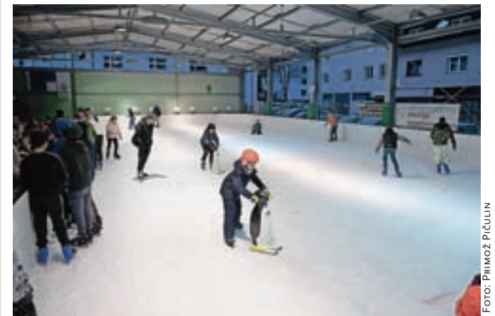
Rekreacijsko drnanje na Ravnah. Slika je simbolična.