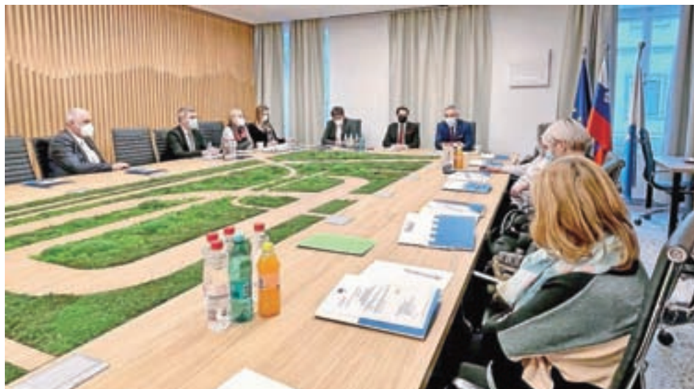
Na šesti redni seji Sosveta starejših Občine Tržič je sodeloval tudi minister Janez Cigler Kralj.

V okviru regijskega obiska vlade je bilo v Tržiču tudi srečanje ministra za javno upravo Boštjana Koritnika in državne sekretarke Urške Ban z župani gorenjske statistične regije. Gostitelj tržiški župan Borut Sajovic je opozoril na problematiko učinkovitosti pri izdaji gradbenih dovoljenj. "Prosimo za pomoč in dodatne zaposlitve na Upravni enoti Tržič,