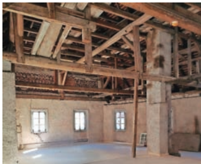
Prenovljeno ostrešje Pollakove kajže

Tržič – V sklopu projekta Energetska sanacija gradu Neuhaus in Tržiškega muzeja, ki se izvaja v okviru operacije Celovita energetska obnova objektov v lasti Občine Tržič, Občine Kamnik in Občine Preddvor, se zaključujejo dela v Tržiškem muzeju. S tem je ta spomenik stavne dediščine obvarovan pred nadaljnjimi poškodbami; zamenjali so okna in preprečili toplotne izgube, odpravili vlago v kletnih prostorih, sanirali rake ... Tudi pod v podstrešnih prostorih je izoliran in prenovljen. Prenova je potekala v sodelovanju z zavodom za varstvo kulturne dediščine. »Če želimo, da je muzej zanimiv in atraktiven za obiskovalce, so potre-