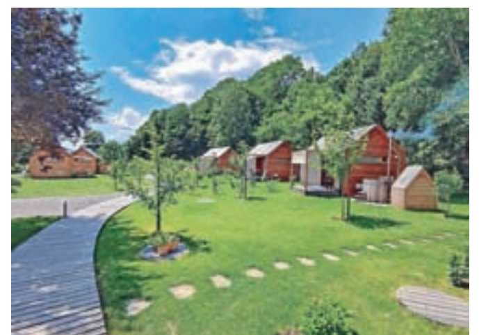
Glamping v gorski pravljici

"V podjetju Magnocor smo izredno ponosni, da smo prejeli priznanje ambasador občine Tržič. Ta naziv nam pomeni veliko nagrado za opravljeno delo v preteklih štirih letih ter odlično motivacijo za nadaljnji razvoj glampinga v gorski pravljici. Za največji uspeh si štejejo, da nam je uspelo povezati veliko število lokalnih