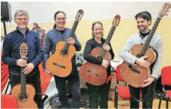
Kitarski ansambel Svarun v decembru že tradicionalno razveseli tržiške ljubitelje glasbe.

ciklus del z naslovom Škrjančev spev – gre za štiri daljše skladbe, pisane za več kitar, ki uglasbijo poetično pesnitev, napisano prav v ta namen. Tokrat se je skladatelj odločil, da bodo ta dela povsem instrumentalna, brez vokalov, saj je bil njih namen izrabiti različne oblikovne in zvočne možnosti, ki jih kitarski kvartet omogoča. Vsa dela se vrtijo okoli