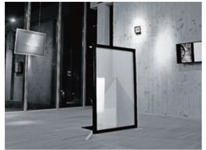
Razstava gledalca vabi k razmisleku o njem samem in svetu, v katerem živimo.

likovnih ciklusih in motivih načrtno prehaja med različnimi likovnimi mediji in jih povezuje med seboj. Veliko njenih del se navezuje na družbo in naravo v domačem okolju in tudi kot osrednji tematski fokus razstave v Paviljonu NOB je izbrala dom. Na ogled so bila dela, povezana z njeno raziskavo in koncepti iz serije Čas – oko – telo ter eksperimentalne fotografije s camera obscura iz projekta Rekonstrukcija projicirane slike.