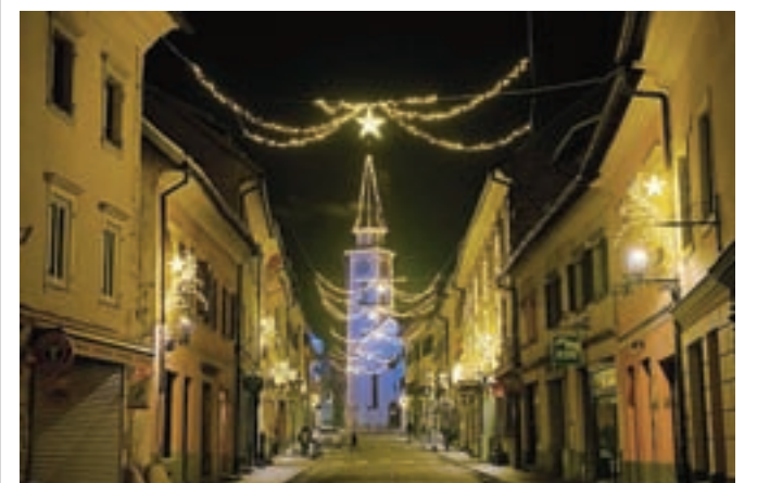
Praznično okrašeno staro mestno jedro.

ski ulici, Partizanski ulici, delu Cankarjeve in Koroške ceste, atriju Občine Tržič, Tržiškem muzeju, Kurnikovi hiši in vseh treh mostovih čez Tržiško Bistrico.