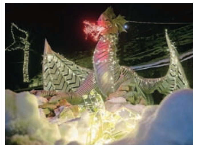
Skulptura zmaja z jajcem